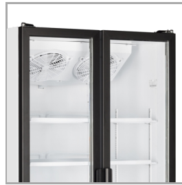
Deuren in volledige hoogte