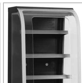
Instelbare planken met kantelfunctie