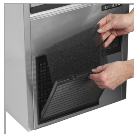
Gemakkelijk te reinigen condensfilter