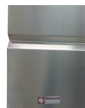
front avec votre marque