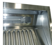
éclairage à encaissement

HOTTE CUBIQUE MURALE 130x140 AVEC ECLAIRAGE A ENCAISEMENT ET GOULOTTE SOUDEE